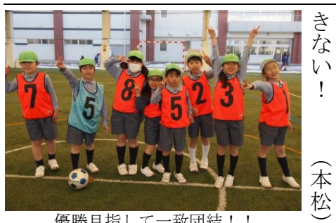
優勝目指して一致団結!!

今年度も、寒風吹きすさぶ凍てつく一月に、一年間で最も熱い大会が開幕した。もはや星小の風物詩ともなった「星野カップ」である。多くのクラスがこの大会の優勝を目指して、一学期から練習に励んでいる。通算四回目を迎える本大会であるが、大会レギュレーションに大幅な変更が加えられた。試合水準の向上を狙い、予選リーグの大幅改変に着手した。この大会の優勝を目指すかどうかが、注目を集めることとなった。一年生が二年生に勝つたり、五年生が個人技で六年生を翻弄したりと、学年の枠に囚われずに、皆がサッカーを楽しんでいる。プレーオフ以降は、星野カップ恒例の学年差ハンデが適用されるので、三・四年生が優勝ということも十分にあり得る。今日も星野ドームの熱戦から目を離すことができない!