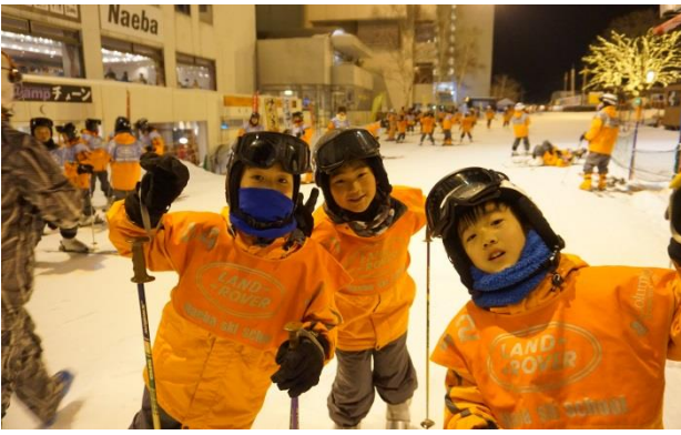
待ちに待ったナイター、スタート!!!

星野学園小学校の一年間は、「冬の学校」で締めくくるとも言える。慣れないスキーに悪戦苦闘しながら、友達と協力しながら自分たちの力で生活をする、まさに一年間のまとめなのである。なかでも四年生は初めて二泊三日になるだけでなく、初めてナイタースキーに挑戦する学年として、いつも以上に緊張する。今号では、そんな四年生にスポットを当てて、冬の学校の魅力に迫りたい。(本松)