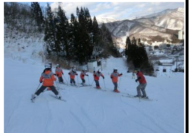
中級グレンデも頑張りました。

自立し、行動した結果である。冬の学校で培ったたくさんの経験は間違いなく子ども達の人生の糧になるであろう。青く澄み渡る空、白く輝くグレンデ、子ども達の笑顔。苗場の地でできた多くの思い出を胸に、今後の学校生活を大切に過ごしてほしい。(土屋)