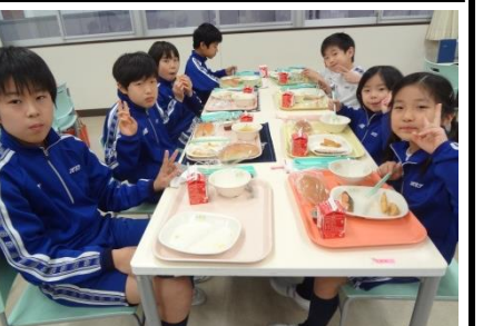
3学期には、異学年交流も!

え、配膳がスムーズに行えるようになり、六年生ともなれば、教員が手を出す隙も無い。私の担任する三年生のクラスでは、毎日缶を空にしている。男の子も女の子も、一生懸命に食べ、競うようにしておかわりをす。子どもたちの元気な笑顔が広がっている。(海野)