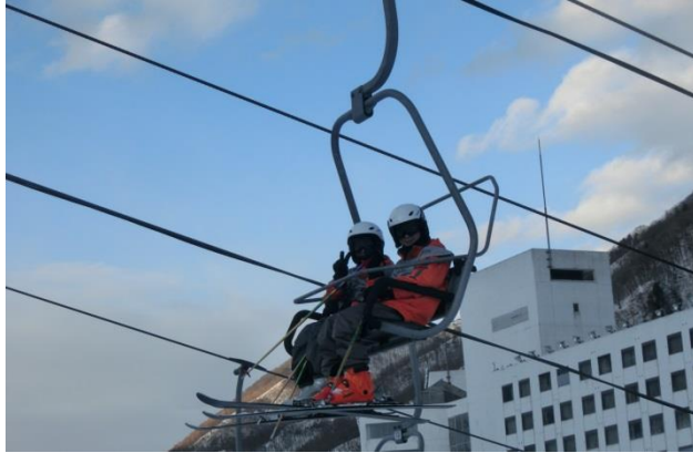
快晴で、リフトもとても気持ち良かったです。

二〇一六年二月四日(木)〜六日(土)、星野学園小学校の四年生は九回目の冬の学校を迎えた。苗場スキー場の天気はなんと三日間快晴。現地のインストラクターさんやホテルの方々もとても驚いていた。子ども達はそんな素晴らしい天候に恵まれ、スキーの実習を楽しみ、実習の合間には苗場の自然についても学ぶことができた。グレンデはもちろん、多くの場面でお互いが思いやりの心を持って協力し合い、行動する姿がとても印象的であった。本校では、「学年に応じた