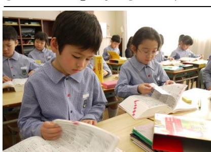
辞書引きが早くできるようになった。

までにもっとこうなつて欲しいという願ひもある。しかし、一番大切なのは子ども達が毎日学校に來ることが楽しいと思えることだと思ふ。残りの日々を大切に二年生への準備をしていきたい。