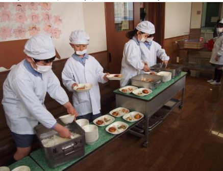
協力をして配膳します。

三時間目にもなると、子どもたちはそれぞれ。「今日の給食は何だろう。」「先生！今日はエビフライが出るよ!」子どもたちは、給食が大好きだ。星野学園小学校では、一年生のうちはランチルームに集まり、食事のマナーを学びながら学年みんなで食べる。箸の持ち方、食器の置き方など、学校以外の場面でも必要となるマナーを日々指導している。入学当初は、配膳や食器の片づけに時間がかかり、こぼしてしまうことも。しかし今では、食べる源は、給食。教室には今日も、食欲を誘ういい匂いと、子どもたちの元気な笑顔が広がっている。(海野)