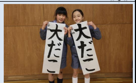
自信を持って書けるようになりました。

道専攻のある大学へ進学するものも多い。このような実績に裏付けされた渡邊教諭の書写指導は、明快の目の前で筆をふる