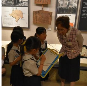
インタビューに初挑戦

川越市立博物館で「川越めぐり」と、三年生七十六名が出かけた。六月一日、快晴の下、校外学習と題した「川越めぐり」へと、三年生七十六名が出かけた。川越城本丸御殿では、事前に学んだことを実際に確かめながら散策した。最後には、菓子屋横丁で頑張った自分へのご褒美としてお買い物をし、充実した一日を締め括った。