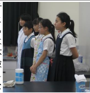
お手伝いの5・6年生

六月十八日(土)、今年度第一回の小学校オープンスクールであった。また、音楽教室では世界で唯一のオリジナルマラカスを作ったり、社会科教室では探検マップを