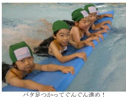
バタ足つかってぐんぐん進め!

図書印刷川越工場では、製版や印刷だけでなく、製品のチェックなどの様子も、実際の工場内に入っていることができた。印刷工場独特のにおいを感じながら、五感を使って見学した内容をメモする児童も多く見られた。