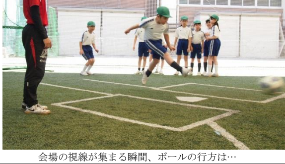
会場の視線が集まる瞬間、ボールの行方は...

一学期恒例のスポーツ行事が、今年度も幕を開けた。星野キックベースクラシックである。注目すべきは、一打席の緊張感である。打者に与えられたチャンスは、一打席の緊張感である。打者に与えられたチャンスは、一打席の緊張感である。