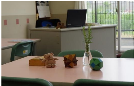
気軽に足を運べる暖かな雰囲気相談室

川越市立博物館で「川越めぐり」と、三年生七十六名が出かけた。六月一日、快晴の下、校外学習と題した「川越めぐり」へと、三年生七十六名が出かけた。川越城本丸御殿では、事前に学んだことを実際に確かめながら散策した。最後には、菓子屋横丁で頑張った自分へのご褒美としてお買い物をし、充実した一日を締め括った。