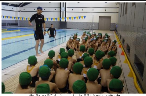
先生の話もしっかり聞いています

六月一日より、待ちにまったプール開きが行われた。特に一年生は、星野学園小学校の魅力ある施設の一つである「床上下可動式室内温水プール」で