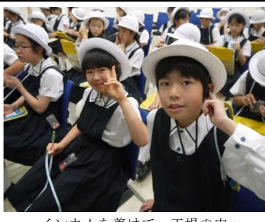
インカムを着けて、工場の中へ

六月三日(金)の朝、意気揚々とバスに乗り込む五年生六十二名、向かった先は川越市と狭山市に跨る川越狭山工業団地である。社会科の授業の中へと向かった。 本田技研工業埼玉で、資料集の写真やホームページの動画を製作所では、本田技研工業や工場を紹介する動画を視聴し、工場内への見学に向かった。今回からは、児童一人一人にインカムが配られ、作業中の工場内でも係の方から説明を聞き漏らすも多くの見られた。