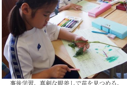
事後学習。真剣な眼差しで苗を見つめる。

印象的だったのは、苗植えが終わりに学校での事後学習だ。多くの児童が、少し頂いて帰った苗を食い入るように観察し、紙にまとめたのだ。川越が植えた苗が、収穫で栽培が盛んである。この体験を通じて、少し