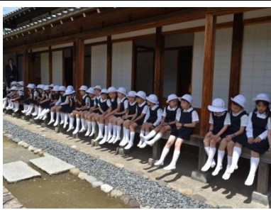
川越城の縁側にて一息。

「川越めぐり」など、参加は、見学するだけでなく、各班テーマを設定し、その中で浮かんだ各自の疑問を設定し解決するために、インタビューを行った。川越城本丸御殿では、事前に学んだことを実際に確かめながら散策した。最後には、菓子屋横丁で頑張った自分へのご褒美としてお買い物をし、充実した一日を締め括った。