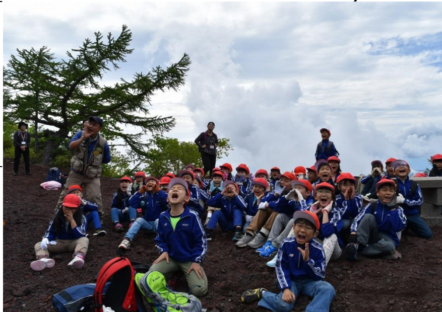
富士山五合目にてこだまに挑戦。「ヤッホ！」。世界文化遺産に、子どもたちの声が響く

三年生は、富士山五合目を開始地点とし、高低差のある登山道を小さな身体で歩き切った。気温が高く、また初めて経験する標高差に負けず、弱音を吐かず、むしろ世界文化遺産である富士山を、五感を存分に使って味わい、笑顔をこぼしながら楽しくトレッキングした。どこまでも澄み渡る青空