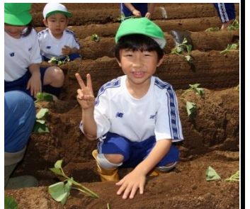
丁寧に植え付けましたよ

六月八日(水)、星野学園小学校の一年生、六十名は川越市内にある農場で、芋の苗植えを行った。前日まで雨が降っており、心配していた天気だったが、当日の朝は青空が広がるよい天気となった。