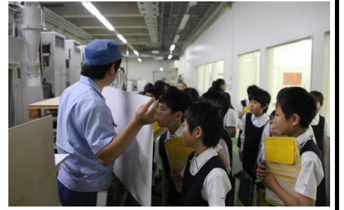
実際の工場内での見学の様子

今回は機械工業と印刷工業の見学であったが、食品工業などの他の工業の工場も見学してみたいと感じた児童も多く、夏休みを待ち遠しく思っているようであった。(渡辺)